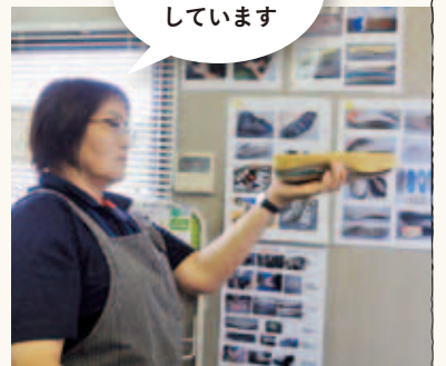
靴の機能を 徹底的に研究 しています