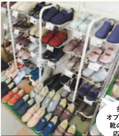
多様な オプションで 靴の悩みに 応えます

相手は高齢者や体の不自由な方です。どんなことで問題を抱えているか正しく理解していないと、本当に役に立つ靴にはなりません。お客様の立場になって、特に安全面に配慮しながら靴を作っています。