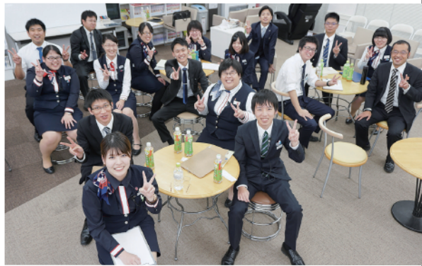
チームワークも抜群!笑顔が弾ける仲間想いのスタッフ。