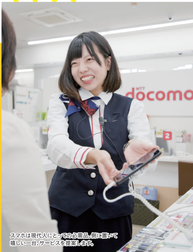
スマホは現代人にとっての必需品。側に置いて嬉しい一台、サービスを提案します。