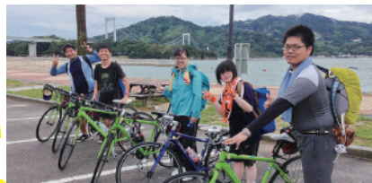
社員が企画する社員旅行の様子。年に一度のお楽しみです。

法人サービスの強さにも定評があり、例えば機種変更の際の見積書や料金のシミュレーションはすべて用紙で提示。手間を惜しまない対応は、比較や検討がしやすいと好評です。「日本で一番ありがとうの多いドコモショップに!」を目標に、日々の心掛けが結実している同社。今後の動向にも注目です。