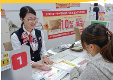
受付、フロア、カウンター、初期設定と担当を分け、スムーズな接客を実現しています。